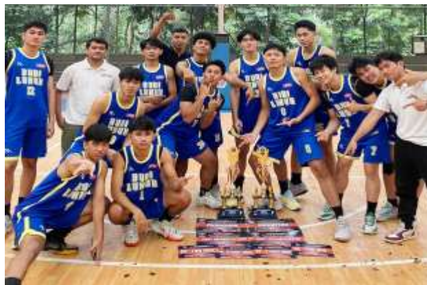
Gambar.1 Tim Bola Basket Putra Universitas Budi Luhur

Tim Bola Basket Universitas Budi Luhur merupakan salah satu organisasi olahraga mahasiswa yang memiliki atlet dengan latar belakang daerah dan suku yang beragam. Kondisi tersebut menjadikan Tim Bola Basket Universitas Budi Luhur sebagai konteks yang relevan untuk mengkaji komunikasi kepemimpinan pelatih dalam mengelola keberagaman budaya atlet. Keberagaman asal daerah atlet tidak hanya menjadi latar sosial tim, tetapi juga menjadi ruang munculnya dinamika komunikasi yang berkaitan dengan perbedaan persepsi, gaya berbicara, dan pola interaksi. Oleh karena itu, kajian terhadap tim ini penting untuk melihat bagaimana pelatih membangun pola komunikasi yang mampu menjembatani perbedaan sekaligus mempertahankan kohesi tim.