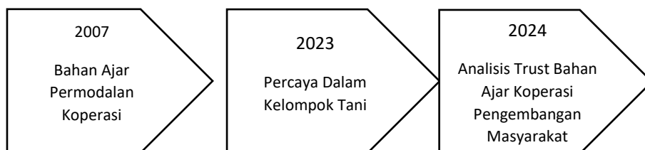
Gambar 1. State of The Art Peneliti