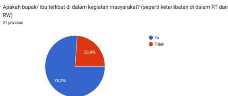
Gambar 1. Hasil dari Kuesioner mengenai keterlibatan umat Paroki Harapan Indah di masyarakat