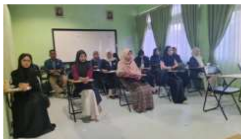
Gambar 2. Pelaksanaan Workshop