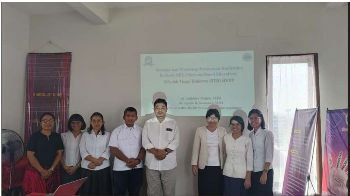
Gambar 3. Peserta Seminar dan Workshop Kurikulum OBE