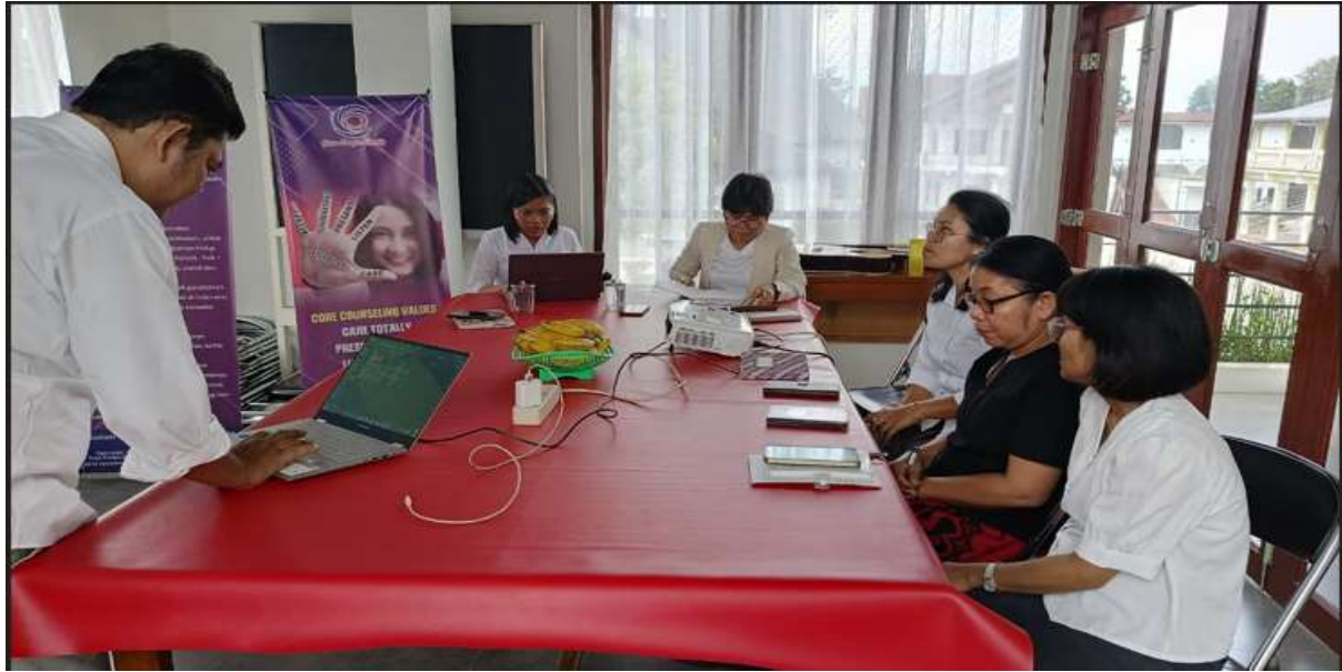
Gambar 2. Workshop Penyusunan Kurikulum OBE