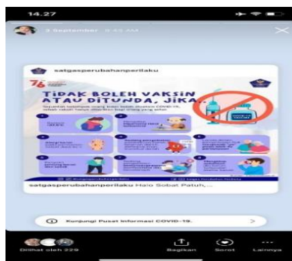
Gambar 2. Infografis yang disebar di media sosial instagram

Berdasarkan hasil kegiatan penyebaran infografis terdapat beberapa respon dari warga net yang berada di Instaram. menandakan, bahwa mereka tertarik dengan infografis tersebut dan berminat untuk menyebarkan infografis kepada teman dan saudaranya. Hal ini menunjukkan bahwa individu tersebut mendapatkan pemahaman dari infografis yang disebar serta memiliki niat atau intensi untuk bertindak dengan menyebarkan kembali infografis tersebut. Dilihat dari banyaknya viewers yang melihat infografis yang disebar menunjukkan bahwa infografis, dapat memberikan pemahaman yang lebih mudah serta lebih menarik untuk dibaca, dibandingkan informasi yang berbasis teks. Selain itu, dengan banyaknya viewers yang melihat infografis, menjadikan banyaknya masyarakat yang teredukasi akan pentingnya kesehatan di masa pandemi Covid-19.