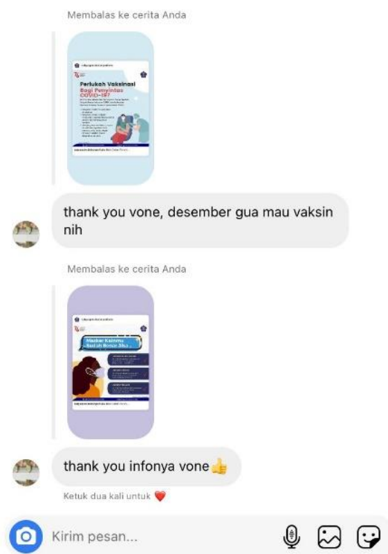
Gambar 3. Respon Terhadap Infografis yang Disebar