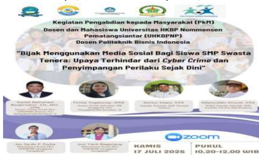
Gambar 1. Dokumentasi Pelaksanaan Kegiatan Pengabdian Kepada Masyarakat (PkM)

Verifikasi Informasi Sebelum Membagikan: memeriksa sumber informasi dan kredibilitasnya, membandingkan informasi dari berbagai sumber, menggunakan alat pengecekan fakta online, berhati-hati terhadap berita sensasional atau terlalu mengejutkan, tidak membagikan informasi yang belum terverifikasi kebenarannya (Kusno, Arimi, & Wahidiyas, 2022).