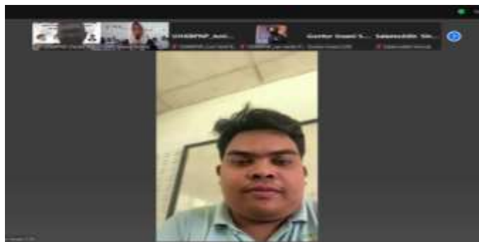
Gambar 2. Dokumentasi Pelaksanaan Kegiatan Pengabdian Kepada Masyarakat (PkM)