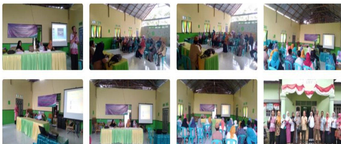
Gambar 1. Bukti Pelaksanaan Pengabdian Yang Dilakukan Oleh Dosen IAIN Sultan Amai Gorontalo

https://aks-febi.iaingorontalo.ac.id/pengabdian/pengabdian-dosen/